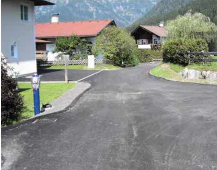
Mit der Asphaltierung konnten die umfangreichen Bauarbeiten endgültig abgeschlossen werden.

In diesem Zuge wurden weiters Glasfaserleitungen durch die Ortswärme St. Johann in Tirol GmbH. verlegt, zudem erfolgten div. Leitungsverlegungen durch die TIWAG sowie für den Ausbau des Fernwärmenetzes der Biowärme, Waidring, eGen. Diese nicht in den Aufgabenbereich der Gemeinde und der Interessentschaft fallenden Zusatzarbeiten erklären auch die damit verbundenen Einschränkungen sowie die Dauer der Bauzeit.