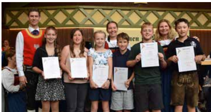
Verleihung der Junior und Bronzenen Leistungsabzeichen.