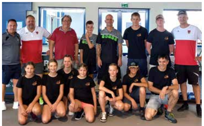
Die jungen Waidringer Stockschützen mit den Nationalteam-Trainern beim Bundeslehrgang in Oberwart im Burgenland.