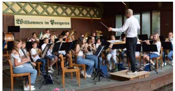
Kurzkonzert des Schülerblasorchesters „Pillersee Connection“.