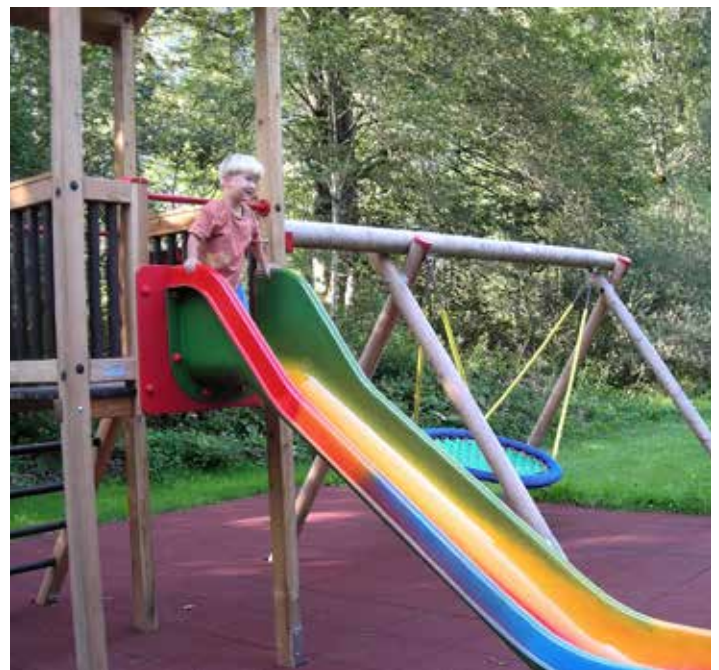
Zusätzlich zur Badeanlage wurde auch die Kneippanlage mit neuen Spielgeräten bestückt